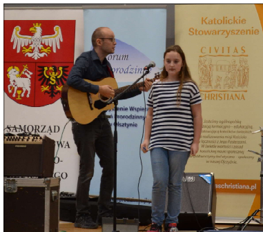
Występ zespołu „Krew, Pot i Łzy”, który tworzą uczniowie Szkoły Muzycznej Casio w Olsztynie (cd. na str. następczej)