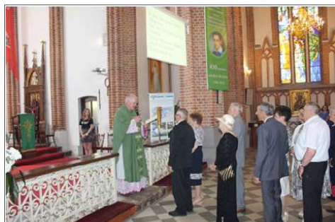
Jubileusze małżeńskie - Janowiec Kościelny