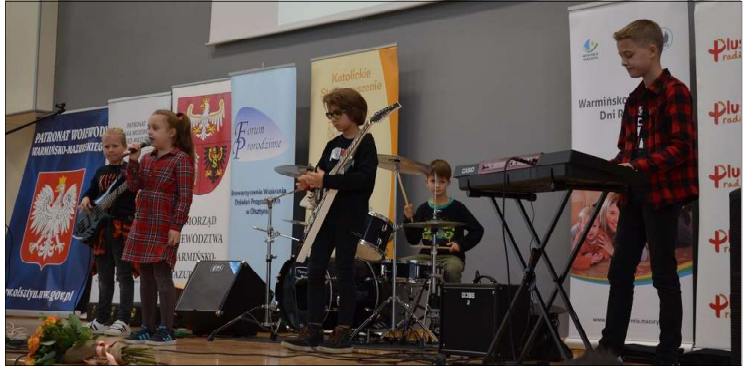
Występ zespołu „Krew, Pot i Łzy”