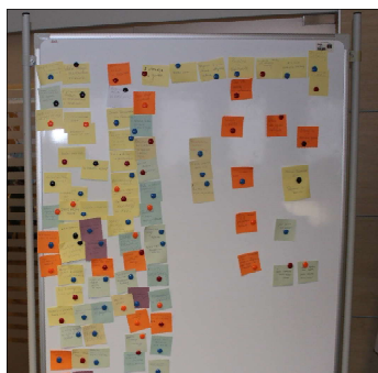
Jest z czego wybierać