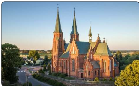
Kościół pw. św. Jana Chrzciciela w Janowcu Kościelnym