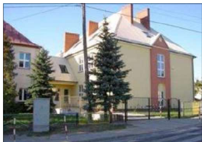
Zespół Szkół im. Jana Pawła II w Janowcu Kościelnym