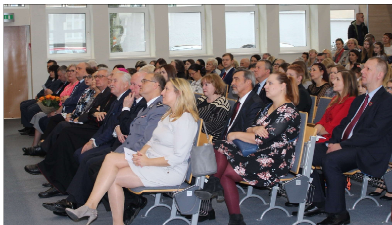
Z prawej: Uczestnicy Konferencji. W pierwszym rzędzie Goście Honorowi