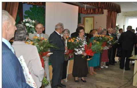
Jubileusze małżeńskie - Nowe Miasto Lubawskie